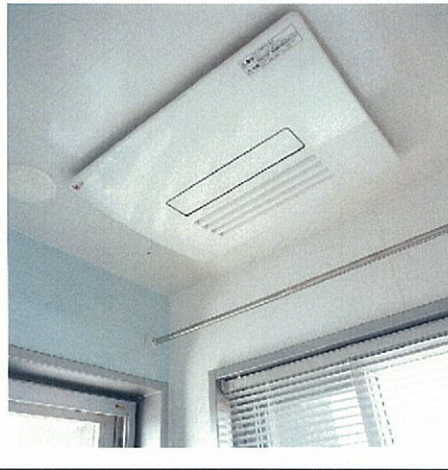
キレイを磨くミストサウナ