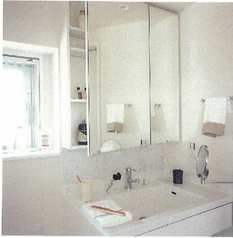
収納たっぷり洗面化粧台