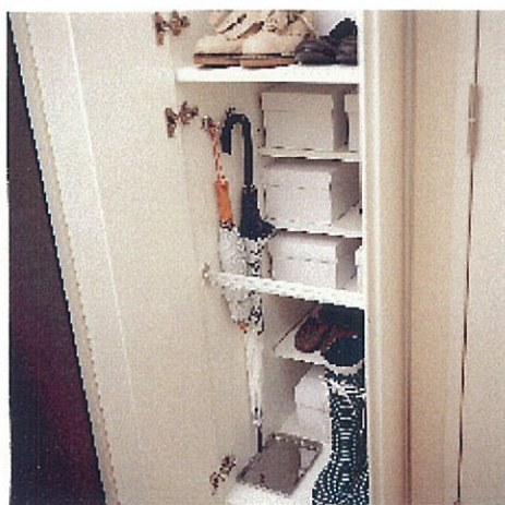
収納充分なおもてなし玄関